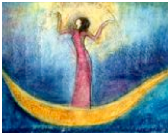
Inanna im Mondboot